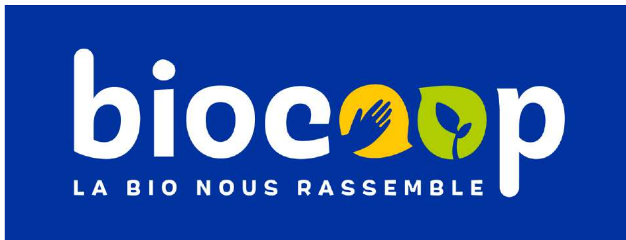
Document 1. Nouveau logo de Biocoop (refonte en 2018)